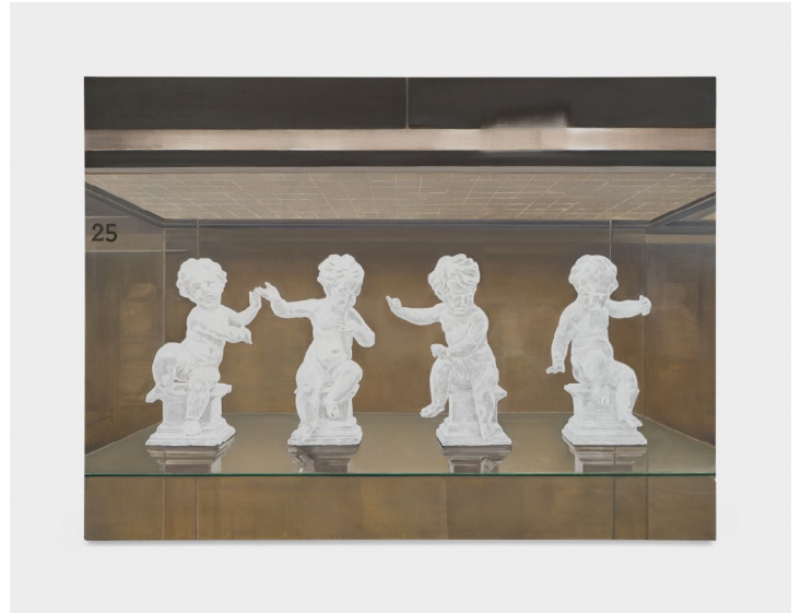
Afterlife, 2022, huile sur toile, 110 x 150 cm