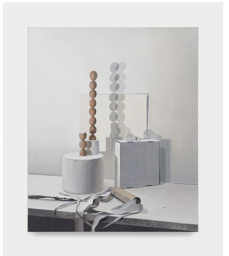
Untitled (shuttlecock) , 2020, huile sur toile, 120 x 100 cm © João Neves