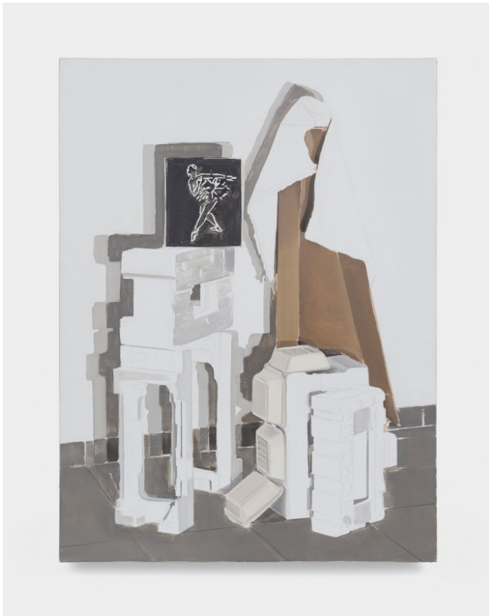
Underpainting , 2021, huile sur toile, 120 x 90 cm © João Neves