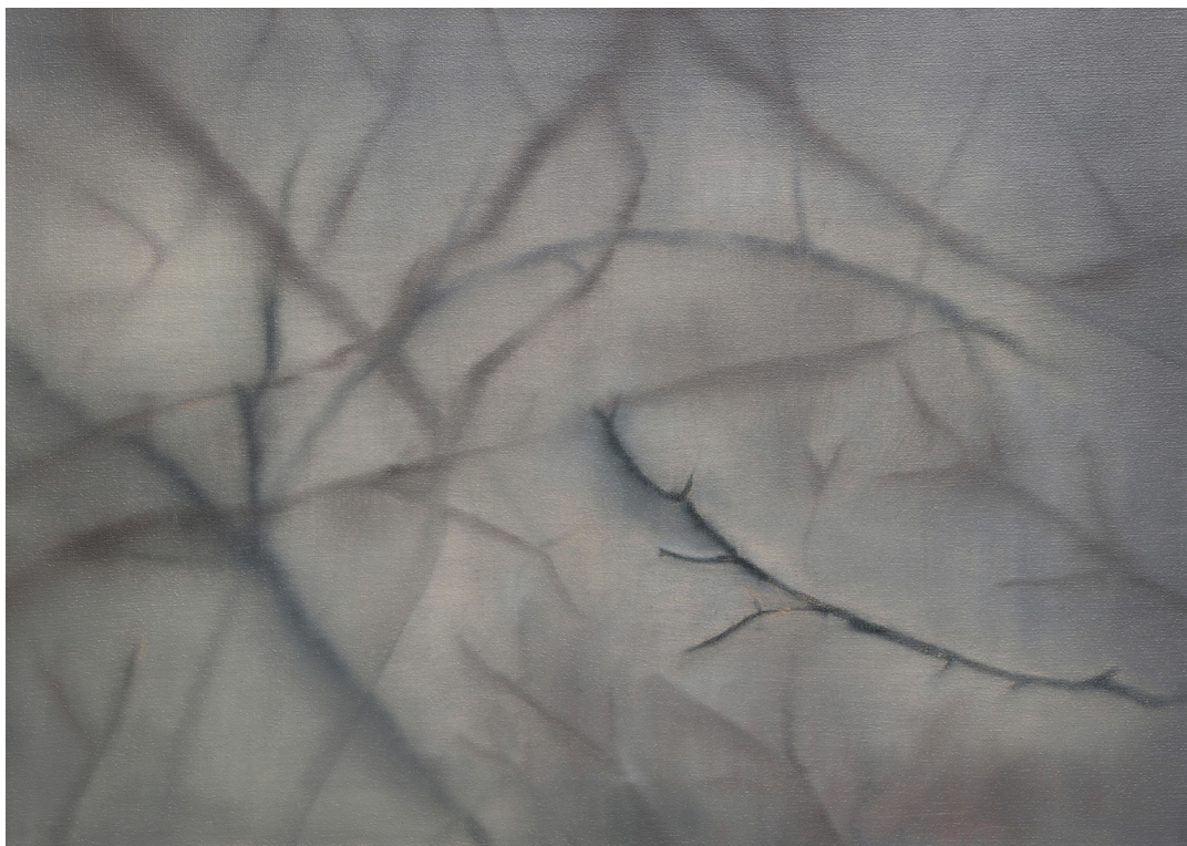
Sin título #32 , 2020-2022, huile sur toile, 35 x 45 cm