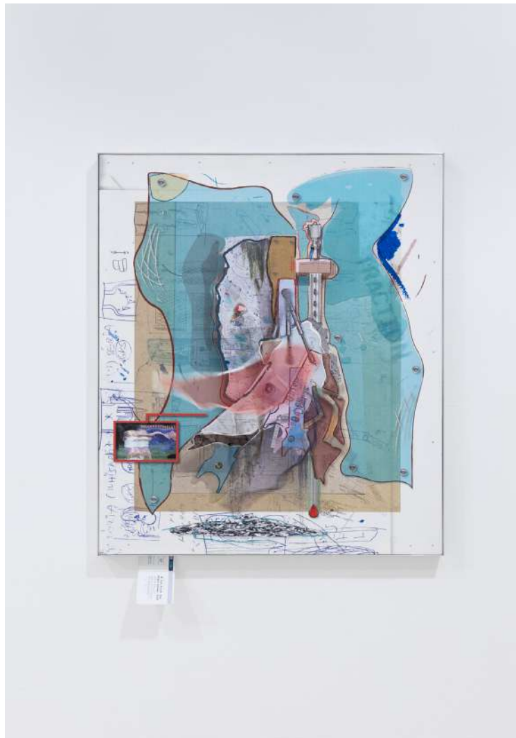
Jakub Choma, If You Blink You Might Loose , 2023