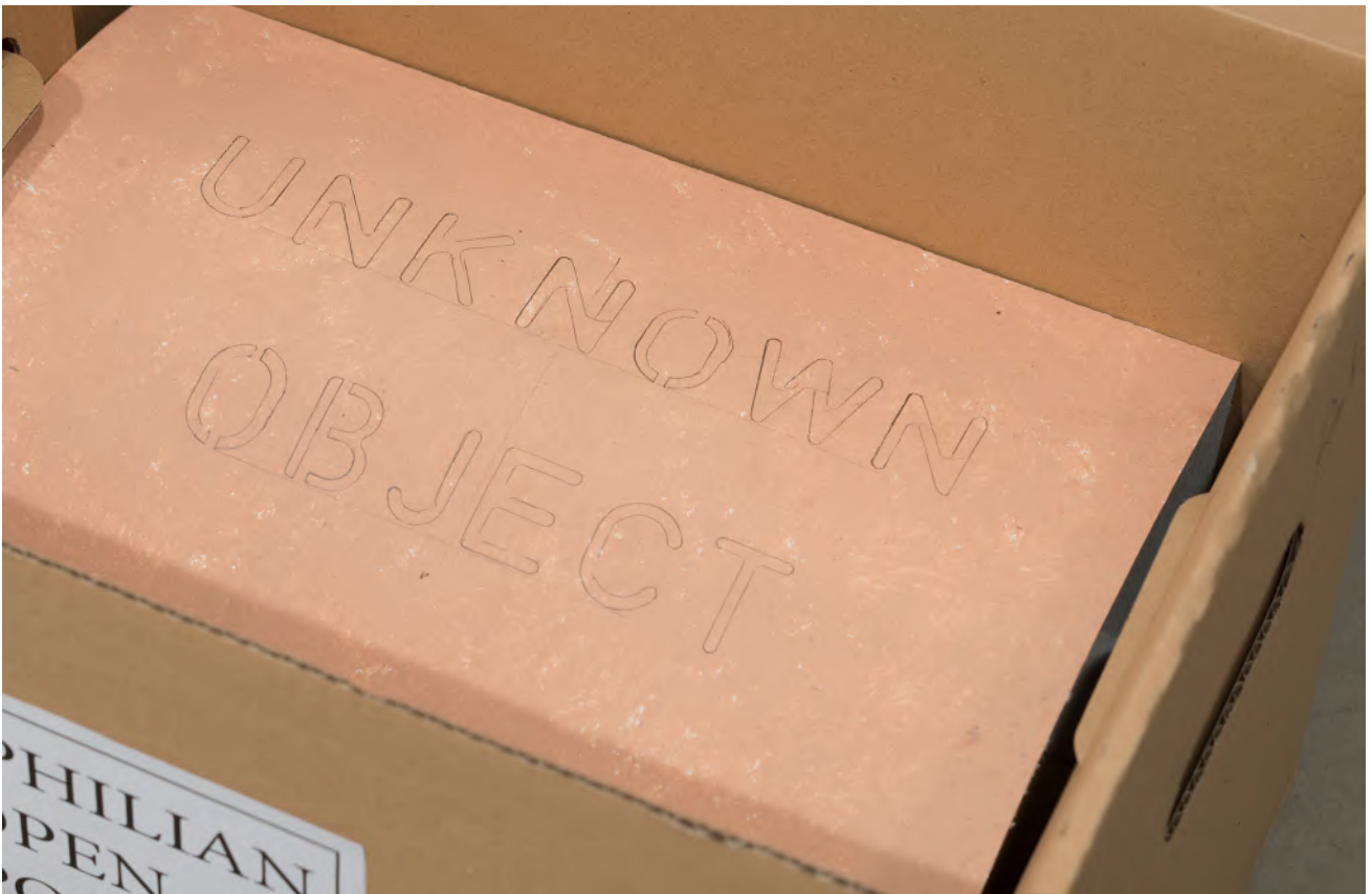
Milan Adamčíak, Panphilian open post / Unknown Object , 2016