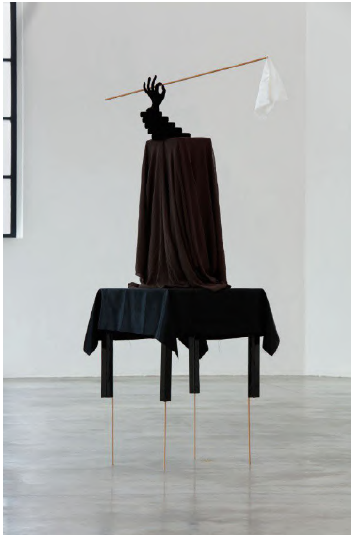
Kateřina Vincourová, Enchantress of Peace , 2016